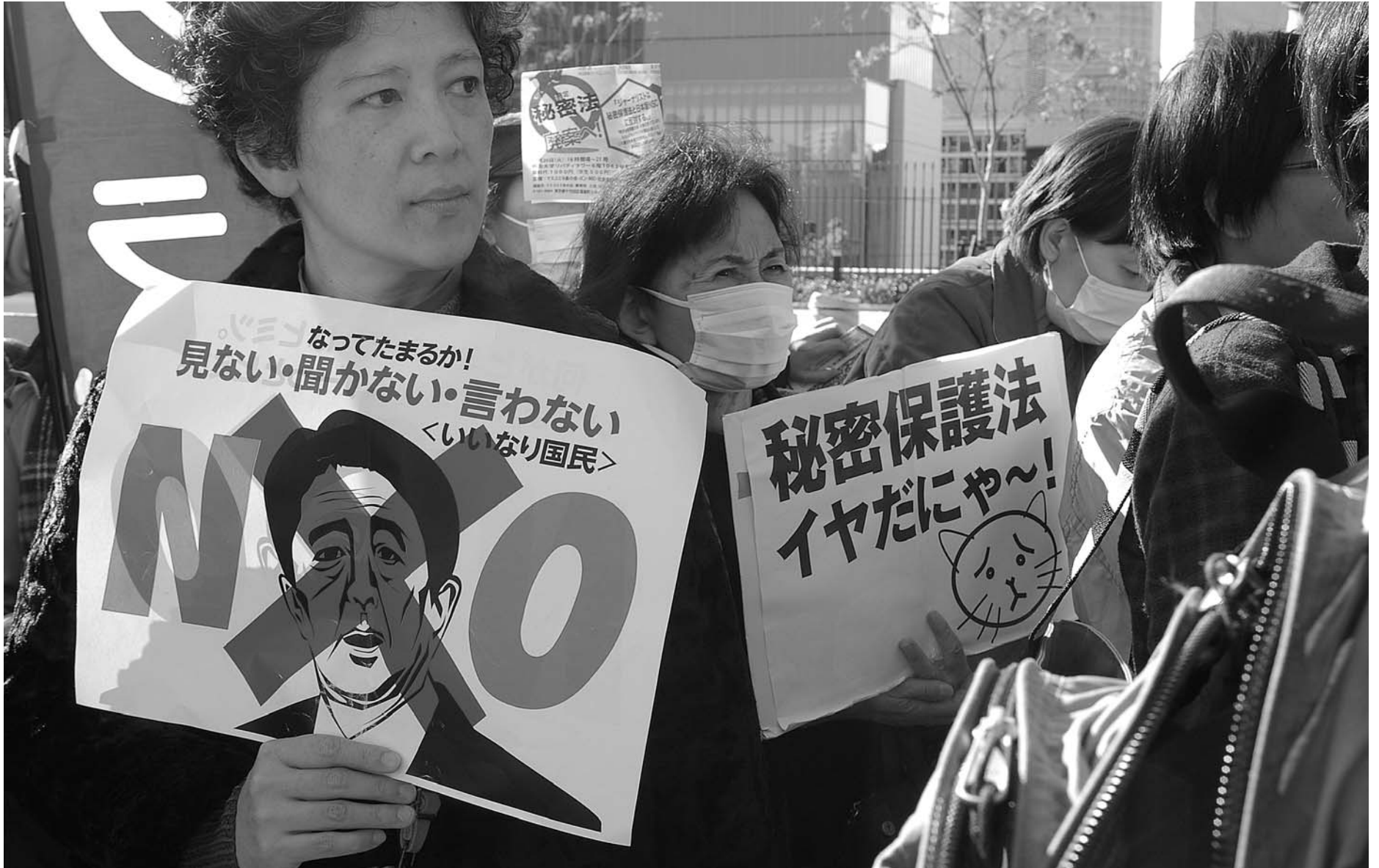
秘密保護法に抗議＝11月26日