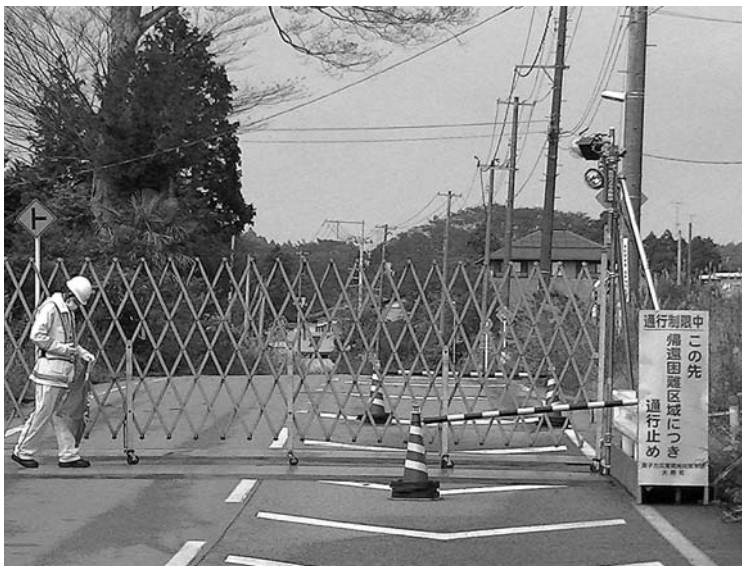
大熊町の帰還困難区域