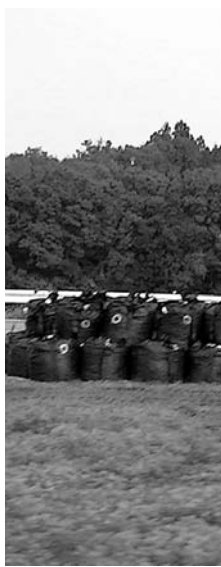
除染土の袋が山積み

大熊町では車中から見 学。帰還困難区域との境の バリケードには警備員が 立っている。放射線量を測 定すると、車内で1・20マ イクロシベルト。 次に富岡町に戻って帰還 困難区域との境へ。富岡町 には警備員はおらず、下車 して見学。参加者では防護 服を着た人と着てない人が 混在。