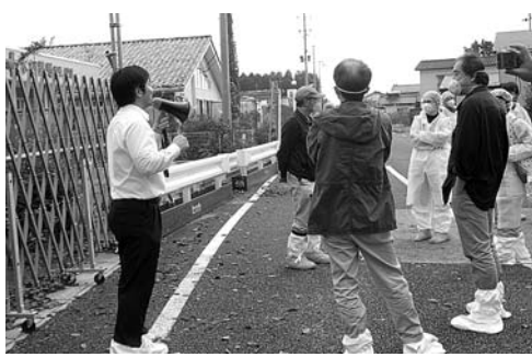
富岡町の帰還困難区域との境で

富岡町では、最初に富岡 町連絡所へ行き、サ 富岡町では、最初に富岡 町連絡所へ行き、サ